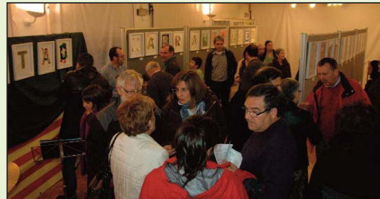
Inauguración en Alcorisa el 13 de abril

Se va cumpliendo así uno de los principales objetivos de este proyecto: que llegue a mucha gente, a muchos lugares, que la creación y la imaginación sobrevuelen nuestro territorio, y que el mensaje del Canto a la libertad resuene y se haga oír.