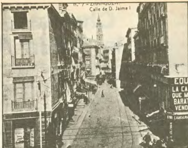
Zaragoza, centro del republicanismo aragonés en la 2.ª década del siglo XX.

El Directorio recién constituido da inmediatamente a