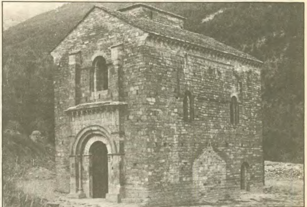
Santa María d'Iguázel

Iguázel ye una ilesia románica de solo qu'una nau rematada por un abside semizerclar, con una torre á o suyo costáu. Ta l'exterior s'ubren dos puertas y sais finestras d'arco de meyo punto, y n'os suyos capítels se beyen un buen nomero d'exemplos d'es-