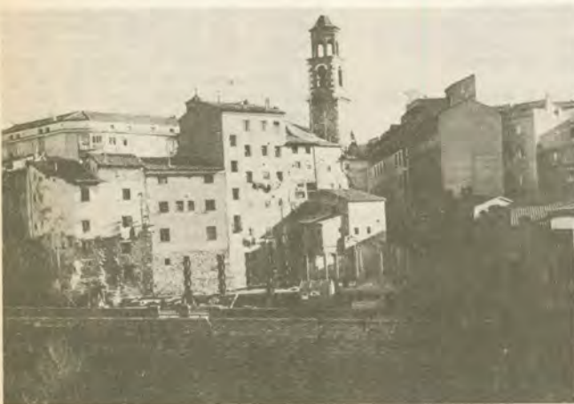
Perspectiva general del inmueble a que se hace referencia en este artículo.

En el caso de los edificios comprendidos en estas zonas es decisiva, pues la autorización de la CPA que, según se nos ha informado, es rigurosa en su actuación y normalmente no permite desmanes; aunque como podrá observarse en este caso, su actuación, concediendo la autorización, creemos que no ha sido muy acertada, puesto que además abre una brecha en la protección de estas «zonas», con la creación de precedentes para futuras edificaciones dentro de las mismas.