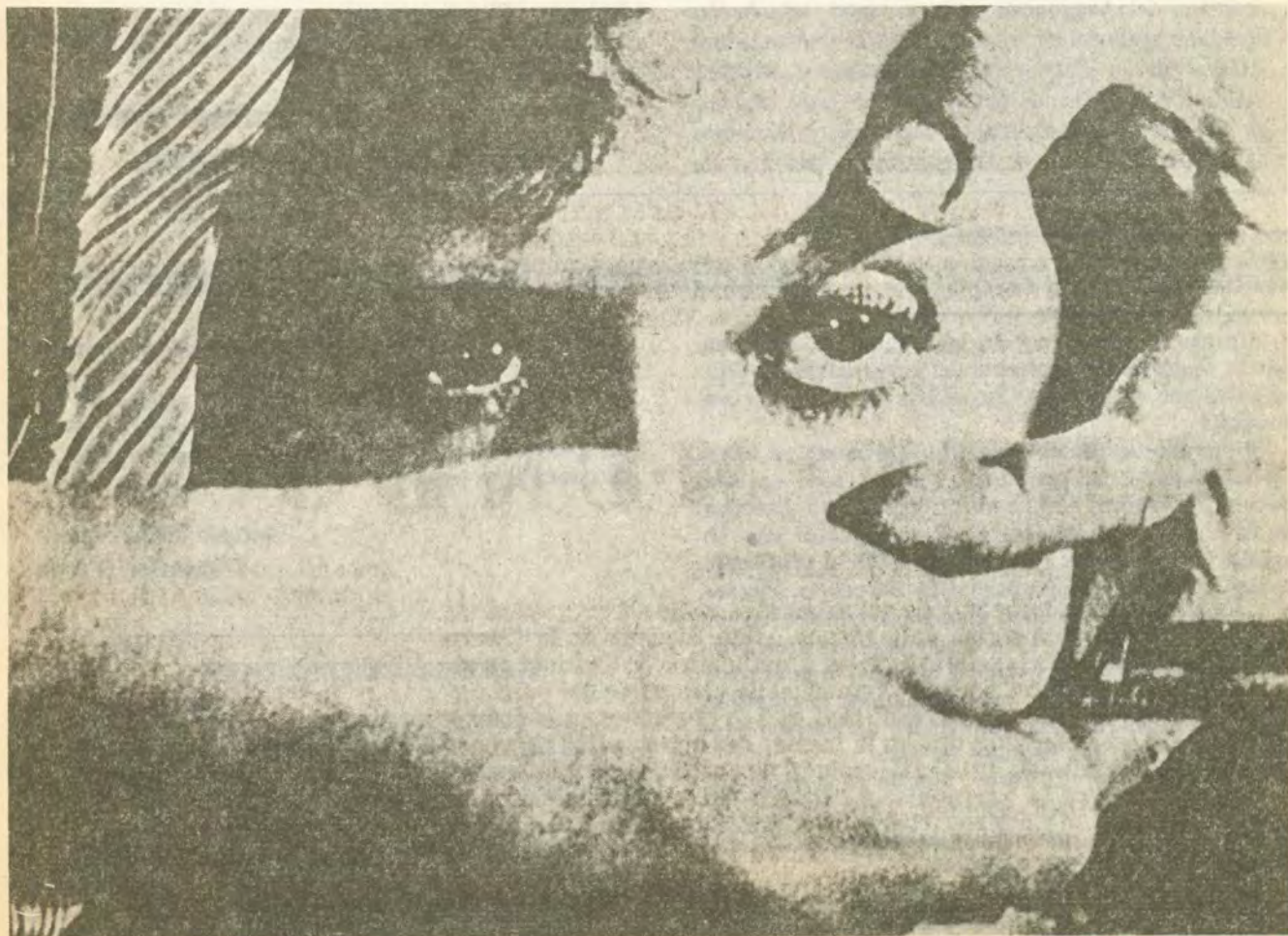
Un perro andaluz