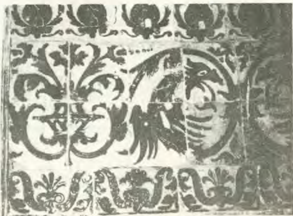
Azulejería de arista. Muel, siglo XVI. Museo Provincial de Bellas Artes de Zaragoza.