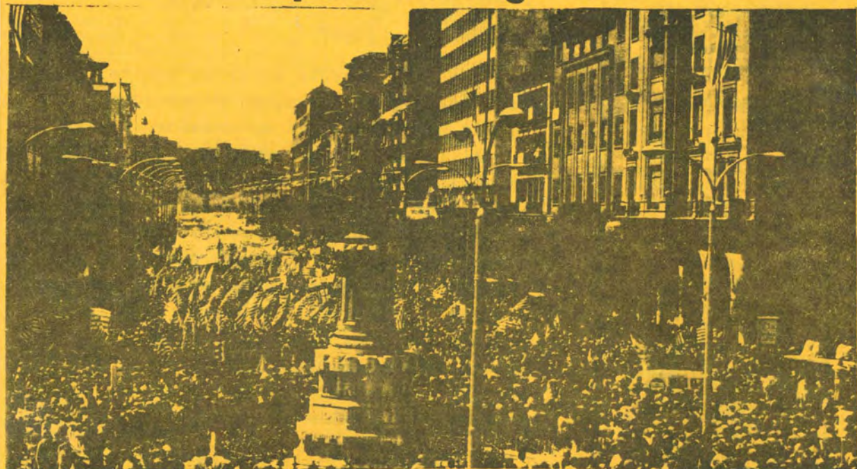
LA I REPUBLICA EN ZARAGOZA(II) (pag. 10-11)