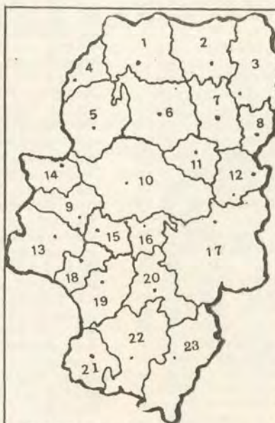
COMARCAS DE ARAGÓN : 1.- BIELLO ARAGÓN (Chaca)

Quizá en ninguna otra nación se haga más palpable la diversidad entre las comarcas, puesto que muy diferente es su extensión, número de habitantes, origen de sus ingresos, tipo de vida social, costumbres, ei muchos casos su lengua, capacidad de producción, necesidades infraestructurales y desarrollo económico.